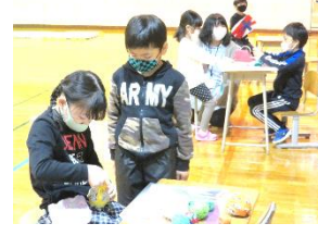
【3,4年図工 タブレットPCを使って】 【1,2年の先輩に、活動するための道具の作り方を教えてもらう】