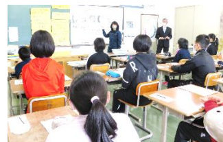
【国語 比喩表現をしてみよう】