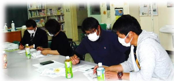
【距離を置きながら熟議】

本来であれば、3校の学校運営協議会、CS委員会メンバーが一堂に会し、グループ協議の中で進めていくはずでした。しかし、感染防止のため、各学校の運営協議会ごとに分担して「目指す子どもの姿」を熟議することにしました。