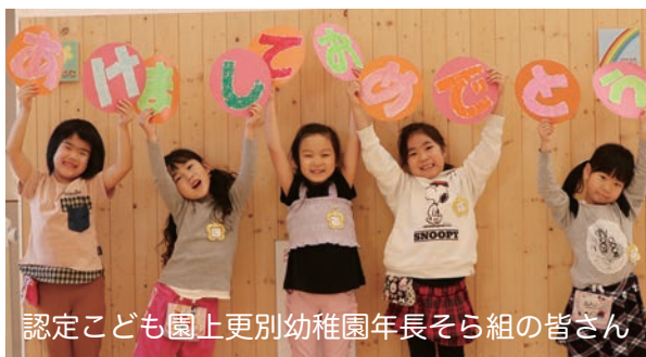
認定こども園上更別幼稚園年長そら組の皆さん