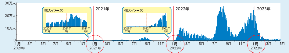
厚生労働省ホームページ「国内の発生状況」をもとに作成