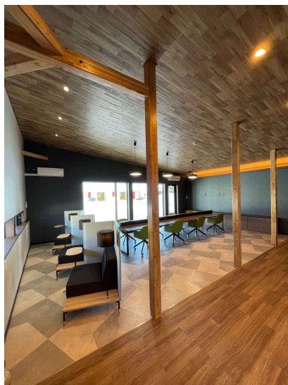
オープンスペース (オフィス5)