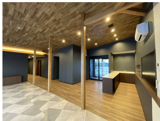
施設内供用箇所 (入口)