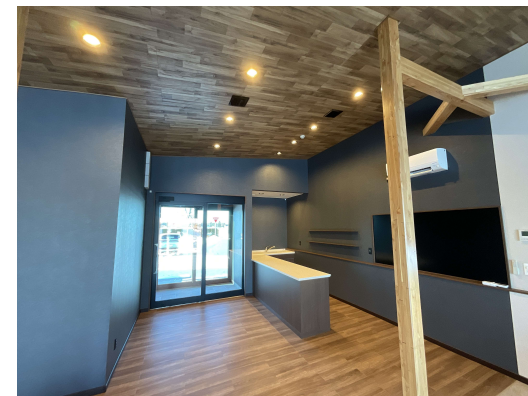
施設内供用箇所 (廊下)