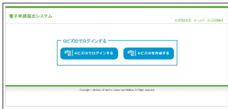
【本システムのログイン画面イメージ】

本システムでご利用できるGビズIDのアカウント種類は、「gBiz IDプライム」と「gBiz IDメンバー」のみになります。