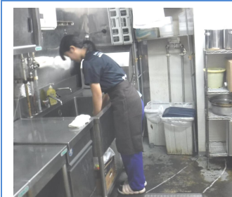
【中国菜館 翡翠樓】 食器・器具洗い