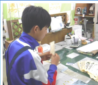
【道の駅「さらべつ」】 カードづくり