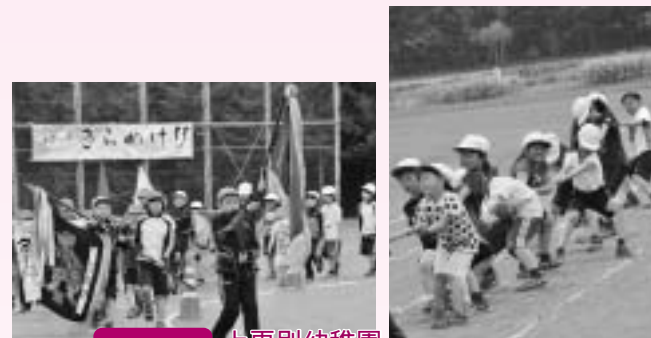
6/8 上更別幼稚園・上更別小学校合同運動会