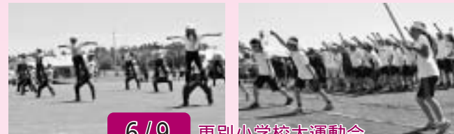
6/9 更別小学校大運動会