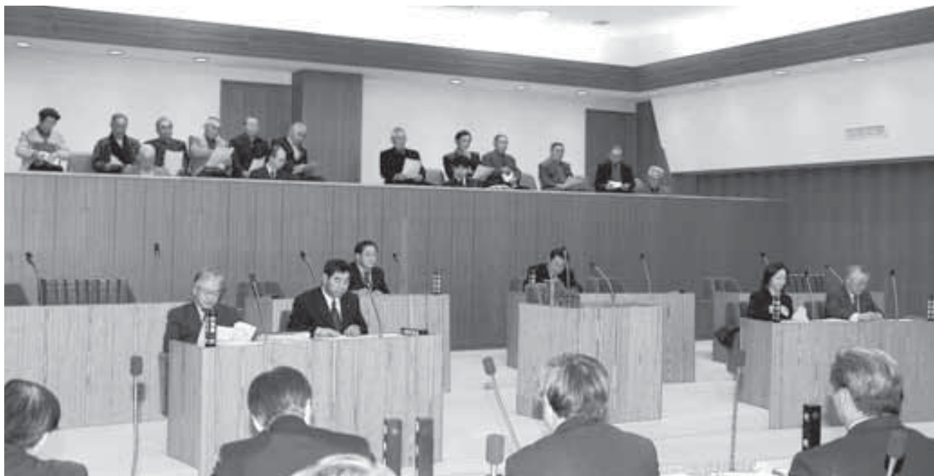
12月21日第4回定例会に議員OBの皆さんが傍聴されました。

ホームページ http://www.sarabetsu.jp/gikaidayori.html