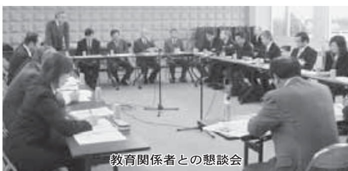
教育関係者との懇談会