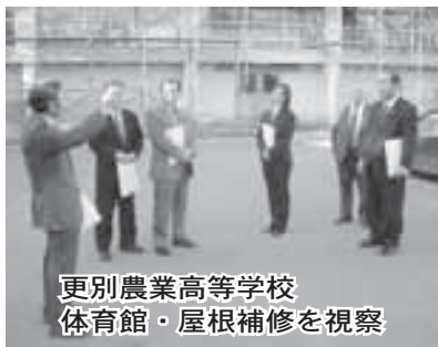
更別農業高等学校 体育館・屋根補修を視察

が必要と結論付けた。 ② 更別農業高等学校は、絶対の確約はないけれども平成22年度までは存続されるということだが、校舎の全面改築は、考えられない現状であり、平成19年度は、体育館の屋根の補修が現在行われている。村も、平成19年から5年間の期限で生徒の確保対策として助成金を増額しているが、厳しい状況は変わらず、なお一層、地域