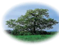
村の木 柏 (かしわ)