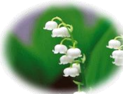
村の花 鈴蘭 (すずらん)