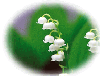
村の花 鈴蘭 (すずらん)