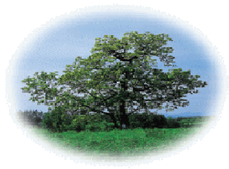
村の木 柏 (かしわ)