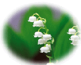
村の花 鈴蘭（すずらん）